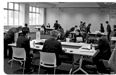
▲情報交換会のイメージ

愛甲学院専門学校、ECC国際外語専門学校、 ECCコンピュータ専門学校、エール学園、大阪観光大学、 大阪経済法科大学、大阪工業技術専門学校、大阪国際大学、 大阪商業大学、大阪情報コンピュータ専門学校 大阪女学院大学/短期大学、大阪電子専門学校、 学校法人大原学園、近畿大学、帝塚山大学、 奈良コンピュータ専門学校、阪南大学、東大阪大学